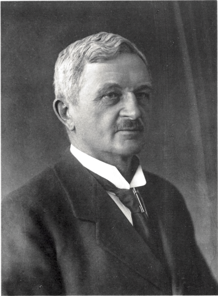
LAURBERG & GAD FOT. 1918